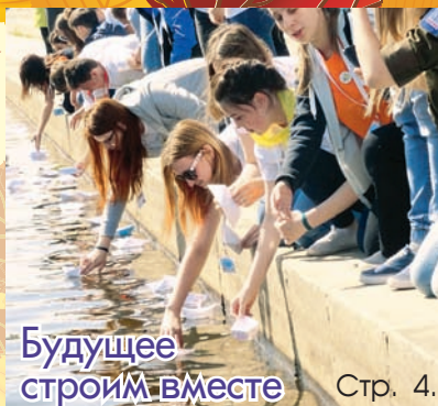
Будущее строим вместе Стр. 4.