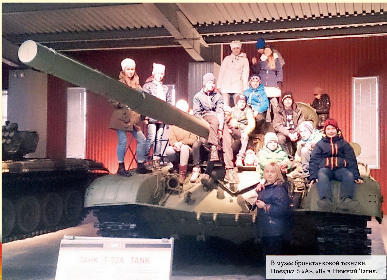
В музее бронетанковой техники. Поездка 6 «А», «В» в Нижний Тагил.