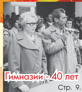
Гимназии - 40 лет Стр. 9.