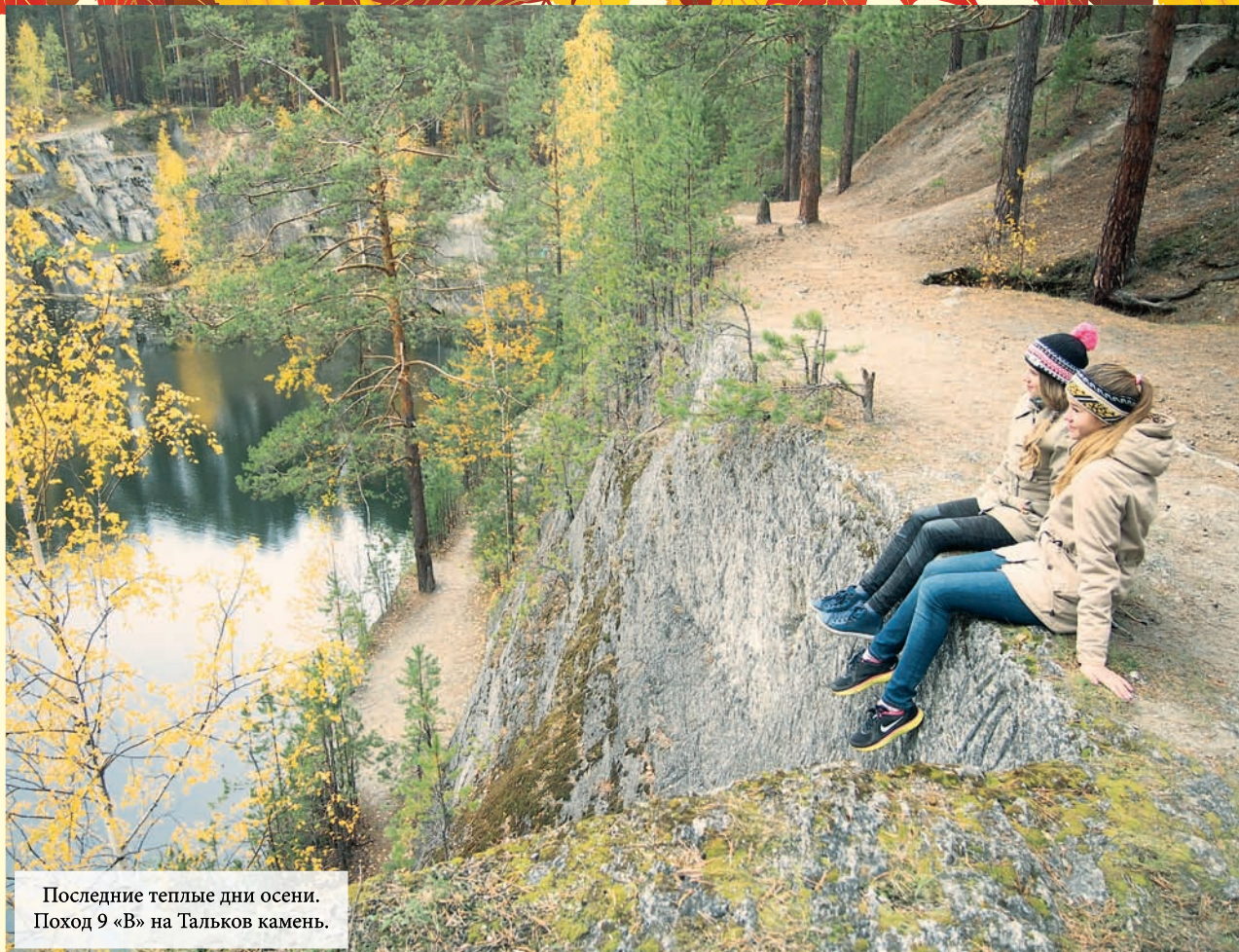
Последние теплые дни осени. Поход 9 «В» на Тальков камень.