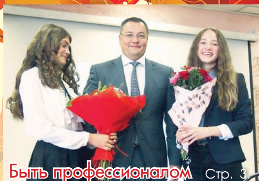
Быть профессионалом Стр. 3

Зарегистрировано в Реестре изданий прессы России. Портал.Срб.ру