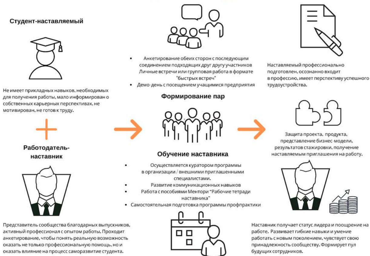
Рисунок 5. Графическое представление наставнического взаимодействия по форме «работодатель – студент»