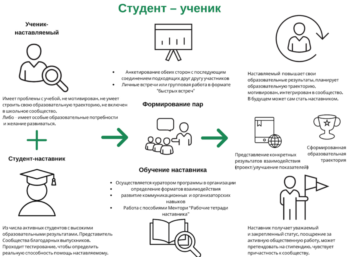
Рисунок 3. Графическое представление наставнического взаимодействия по форме «студент – ученик»