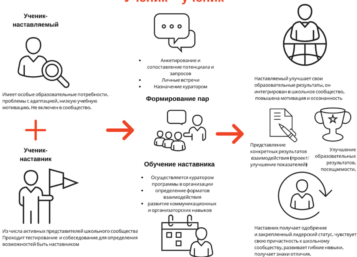
Рисунок 1. Графическое представление взаимодействия по форме «ученик – ученик»