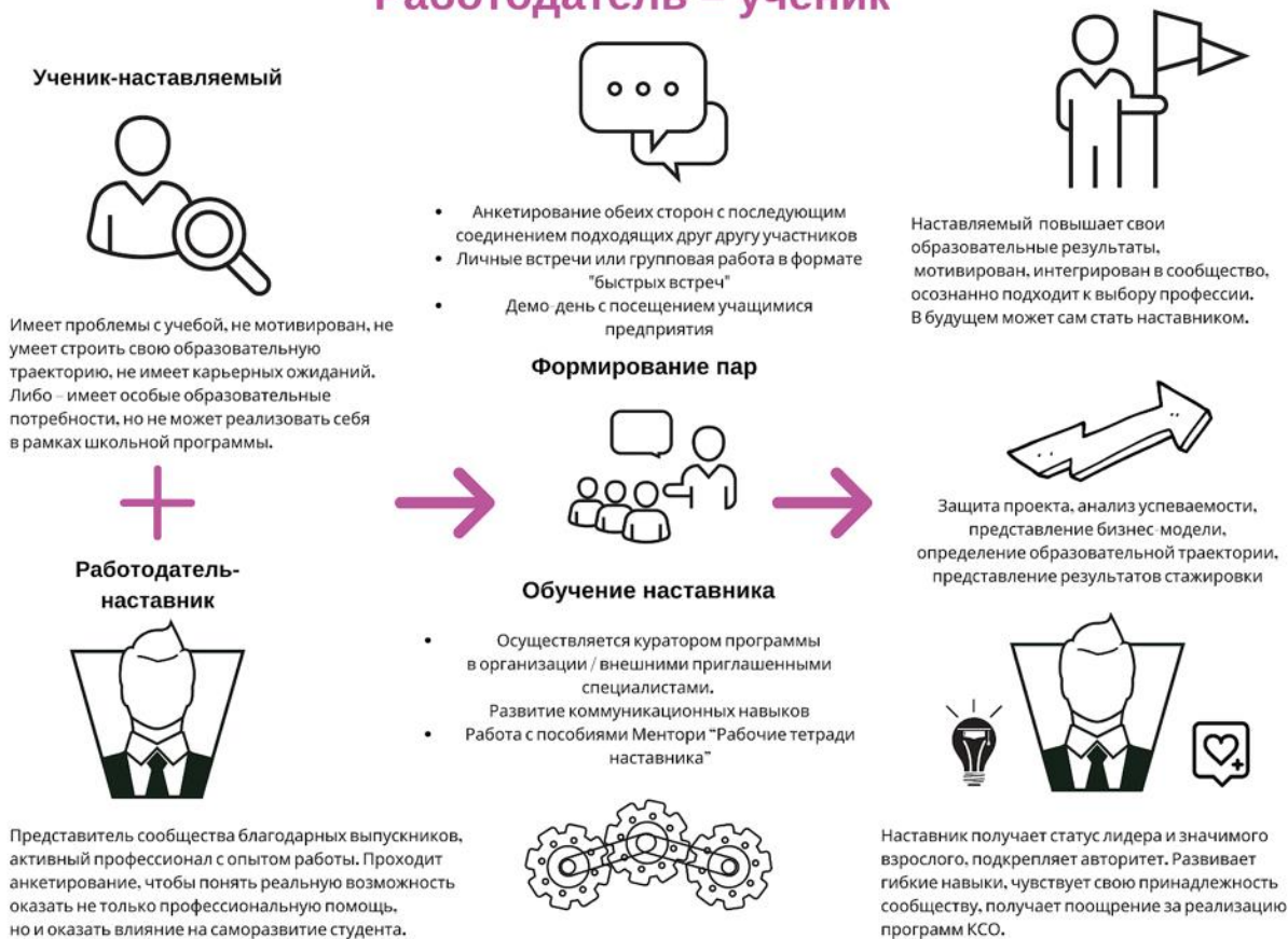
Рисунок 4. Графическое представление наставнического взаимодействия по форме «работодатель – ученик»